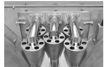
Zyklon-Anlage Cyclone installation Séparation cyclonique